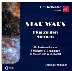
Williams, Chaminade Nielsen, Mozart CD 12,- €