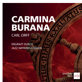
Orff: Carmina Burana, ergänzt durch Jazz-Improvisationen CD 12,- €