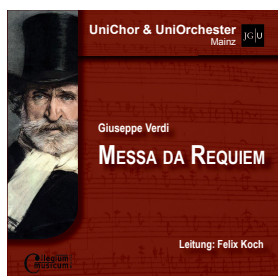
Verdi: Messa da Requiem CD 12,- €