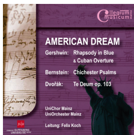
Gershwin, Bernstein, Dvořák CD 12,- €