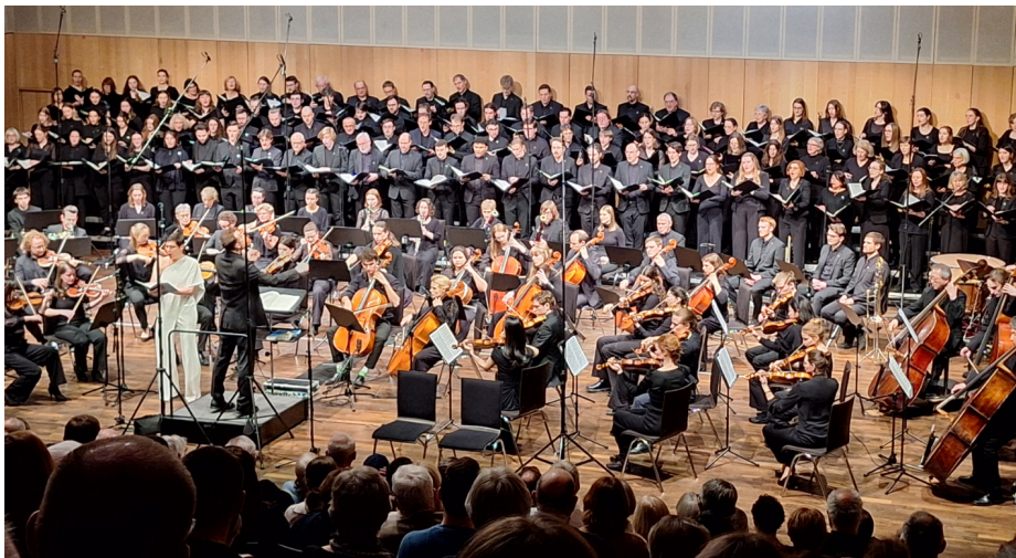
UniOrchester und UniChor