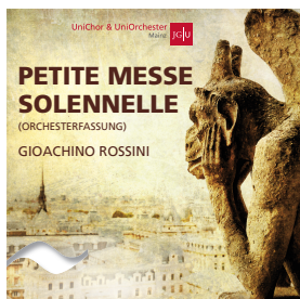
Rossini: Petite Messe Solennelle CD & DVD 15,- €